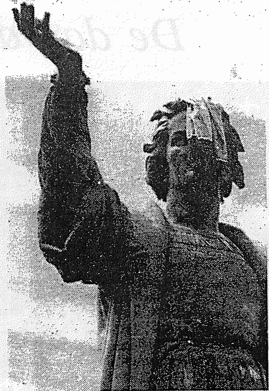
Columbus met een "Mexican touch"