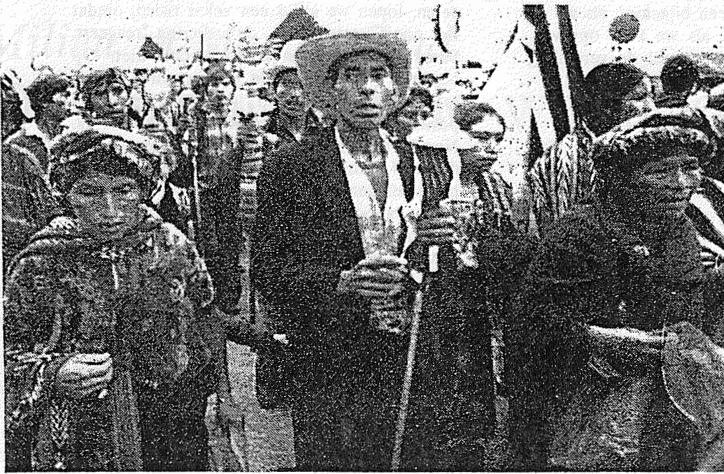
Protesterende Indianen in Guatemala, 12 oktober 1991

doorbracht met het lezen van boeken en het schrijven van verhalen en korte gedichten...Ik had geleerd dat er op deze aarde geen groter goed is dan het leven zelf.'