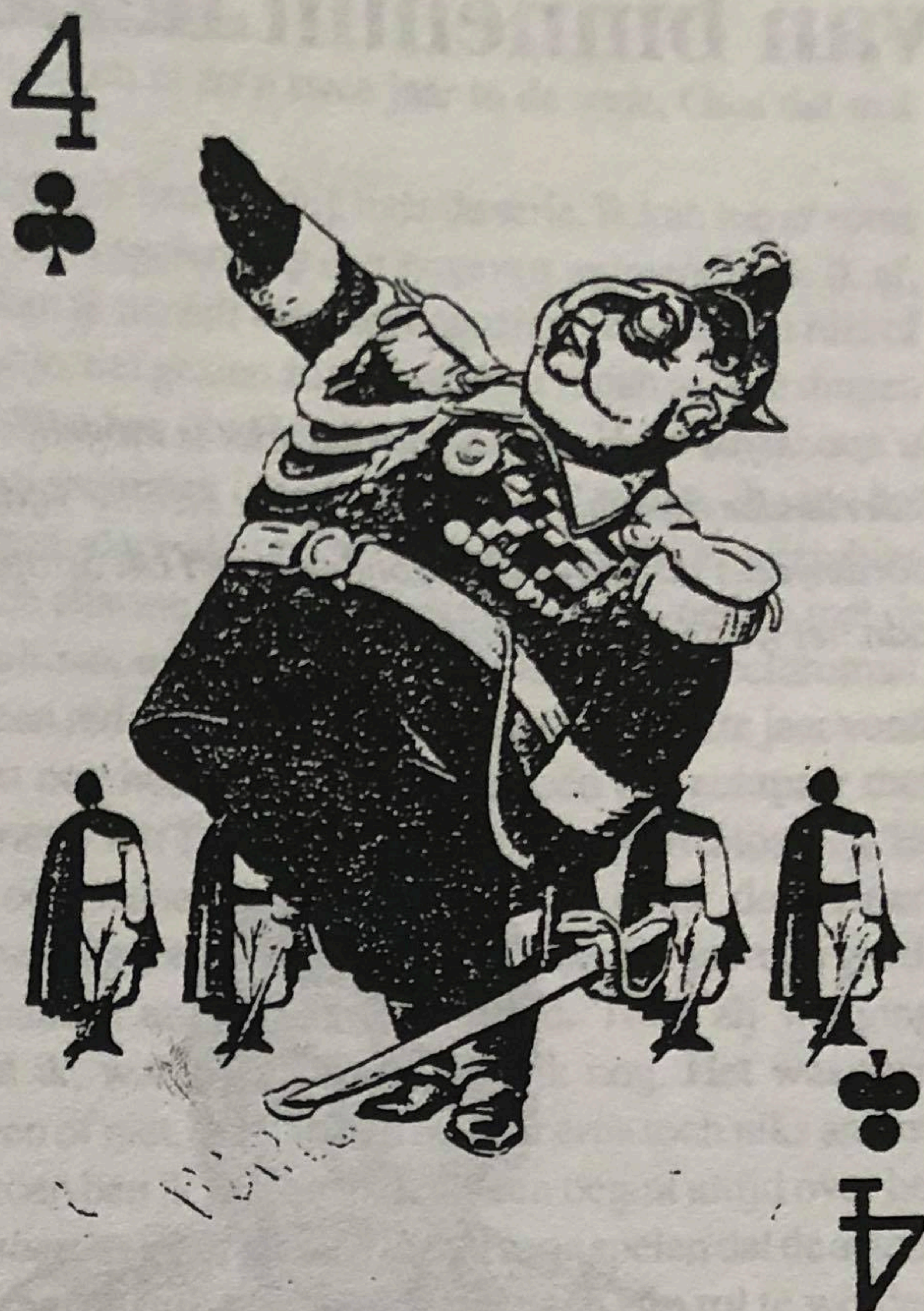
Generalissimo Franco met zijn Moorse lijfwacht, gezien door een tegenstander.

De herdenking is voorbij. Auto's rijden weg met Spaanse vlaggen uit het raam gestoken. Een verkoper informeert of we geïnteresseerd zijn in een ballon met nationalistische